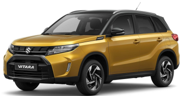
Solar Yellow / Cosmic Black