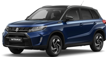
Sphere Blue Pearl / Cosmic Black