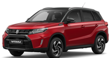
Bright Red / Cosmic Black