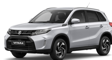
Silky Silver Metallic