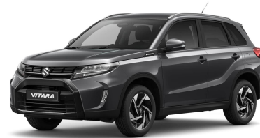
Titan Dark Gray