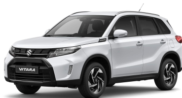
Cool White Metallic