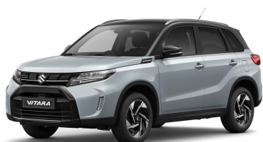
Ice-Grayish Blue / Cosmic Black