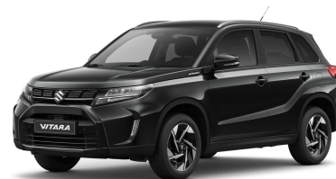
Cosmic Black Metallic