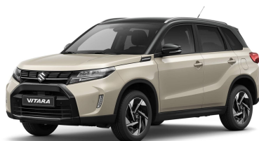
Savanna Ivory / Cosmic Black